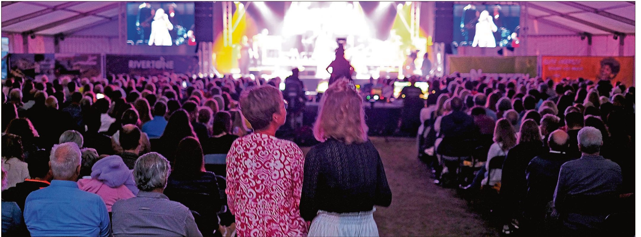
Mitreißende Stimmung am Samstagabend im sehr gut besuchten Rivertone-Zelt.